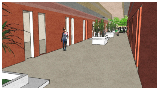
Perspectiva Projeto do edifício "Ciclo Básico"

A expansão do Campus já está prevista para os próximos 30 anos respeitando os princípios de sustentabilidade previstos no seu projeto.